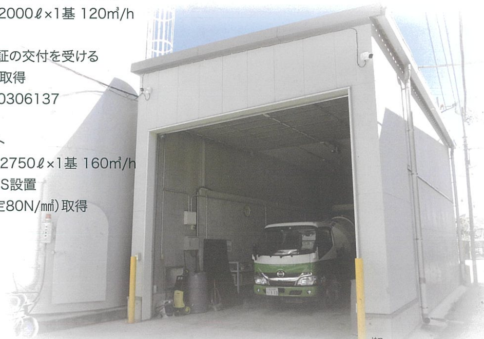
アジテータ車 整備・研りブース